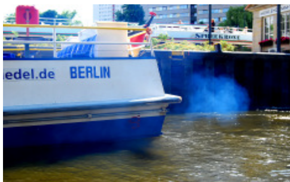
Veraltete Dieselboote vergiften uns – wie lange noch?

Auf dem Bodensee, auf dem Neckar und auf der Binnenalster in Hamburg fahren sie bereits: völlig emissionsfrei betriebene Fahrgastschiffe mit Elektromotoren die 100 Personen und mehr bei Geschwindigkeiten bis zu 15 km/h transportieren können. Was einige immer noch für Zukunftsmusik halten ist bereits Realität. Auch in Berlin wird noch in diesem Sommer ein solares Fahrgastschiff in Betrieb gehen und dafür sorgen, dass Berlin nicht den Anschluss und damit letztlich auch Arbeitsplätze verliert. Wer den Untergang amerikanischer Automobilkonzerne und ihrer europäischen Tochterunternehmen verfolgt hat weiß es längst: Die technologische Vergangenheit lässt sich nur im Museum erfolgreich konservieren – niemals in der Wirtschaft! Wer umweltschädlich produziert und transportiert, der gefährdet letztendlich nicht nur die Umwelt sondern auch die eigenen Arbeitsplätze. Nachhaltigkeit in Stadtentwicklung und Wirtschaft ist deshalb keine Frage der Moral, sondern der Vernunft und die einzig sinnvolle Strategie zur Bewältigung nicht nur der Umwelt- sondern auch der Wirtschaftskrise.