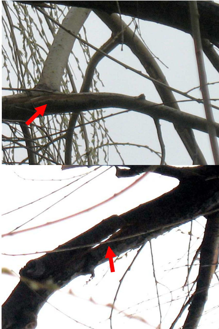
Abb.2a/b: Frische baubedingte Astschäden an 2 Schwachästen über der Wasserlinie.

Die Nachsorge (Rück- und Pflegeschnitt der geschädigten Äste durch die Fa.GVL) wurde veranlasst.