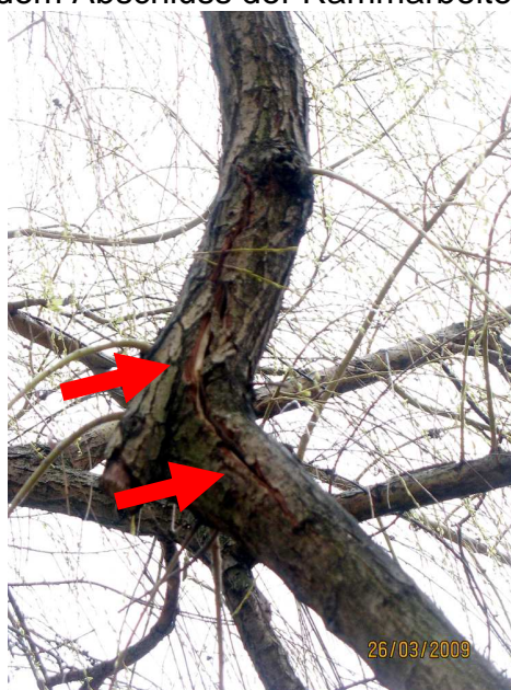
Abb.1: Frische Aufspaltung eines ufernahen Starkastes.